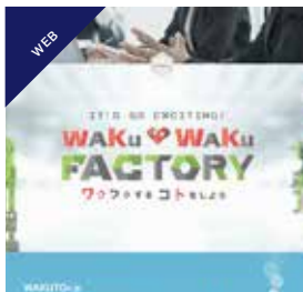
アートディレクション | WEBデザイン