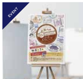
アートディレクション | ポスター | チラシ | チケット