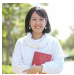
一般社団法人コペンカレッジ 代表理事 株式会社コペンクラブ 代表取締役

結婚や出産といったタイミングで働き方を変えたいと思っている女性はとも多いです。コペンに集まる講師陣や生徒さん達の中にも、同様の悩みで直回しライフスタイルを変えた人がいます。実際に仕事を始めると、子供を育てている以上「一人で」仕事を進めるのはとても大変。そんな時に頼れる仲間がコペンにはたくさんいます。