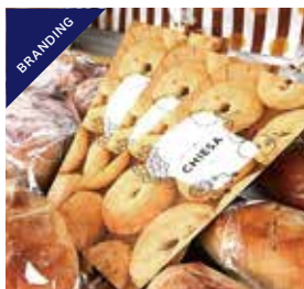
アートディレクション | ロゴ | チラシ | ラッピングカード